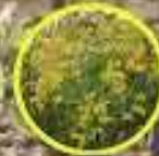
San de Campo