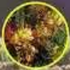
Balsa de Clava