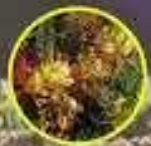
Balsa de Plata