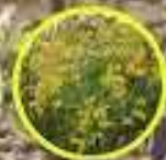
San de Campo